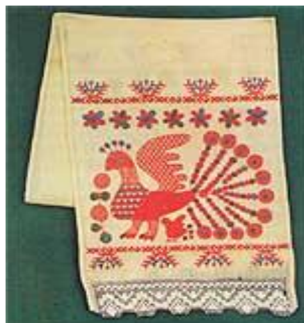
Полотенце. Ф-ка «Восход», г. Орёл, 1970 г.

Коллекция «орловского списка», собранная сотрудниками Орловского краеведческого музея за столетнюю историю его существования, небольшая, насчитывает около сотни единиц хранения. Каждый предмет уникален и неповторим и представляет собой большую эстетическую ценность. То, что в основной своей массе это полотенца, не случайно: в жизни крестьян они выполняли не только утилитарную функцию, но и являлись неизменными атрибутами обрядов и праздников, элементами украшения жилища. Самое раннее полотенце датировано 1796 годом. Это работа крепостной крестьянки Мценского уезда. Композиция вышивки напоминает гобелены XVIII в., элементы орнамента — цветы в вазах.