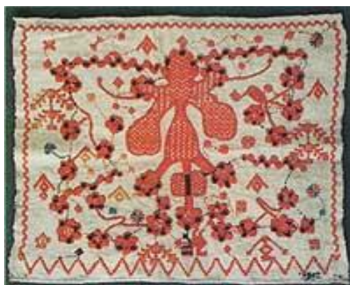
Конец полотенца. Орловская губ. Холст. Нач. XX в.

Откуда орловские мастерицы, простые крестьянки, черпали вдохновение? Как могли возникнуть столь причудливые узоры в воображении практичных женщин? Многие исследователи считают, что само слово «спис» означает «списывать» узоры с зарисованных морозом зимних окон. Крестьянки занимались рукоделием долгими зимними вечерами, сидя у окна при свете лучины либо свечи. Сказочные морозные узоры, увиденные в призрачном мерцании пламени, соединялись в сознании с мечтой — воспоминанием о лете с его яркими красками. Пройдя через художественное воображение мастерицы, нарядными и невиданными выходили они из-под иглы и ложились на полотно. Возможно, это так. Другие исследователи видят в узорах «списа» продолжение традиций древнерусского шитья золотыми и серебряными нитями, недаром его называют ещё русским шитьем. Явно прослеживаются те же округлые, чётко очерченные формы с различной плотностью заполнения фигур и элементами стебельчатого рисунка. Отличительной чертой «орловского списа» является многоликость. В его изменчивых формах можно увидеть много различных символов, фигур, очертаний животных.