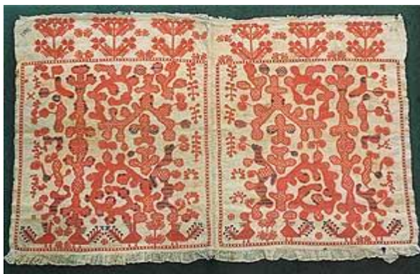
Фрагмент передника-занавески. Орловская губ. XIX в.

чрезвычайно оптимистическое, жизнеутверждающее впечатление. Небольшие синие плоскости и вкрапления создают особую свежесть, рельефность восприятия и необыкновенный живописный эффект. Кроме того, сочетание красного и синего наполнено глубоким духовным смыслом: красный — цвет жизни, «праздника жизни»; синий — цвет неба и воды, тех начал, которые поддерживают жизнь, самую суть её. Позднее, в начале XX века, цветовая гамма становится разнообразнее, вводятся жёлтый, зелёный, синий цвет заменяется на чёрный, цвет «земли-кормилицы».